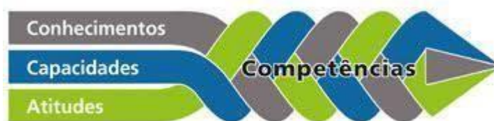
Figura 1: Esquema conceitual de competência adaptado de “The Future of Education and Skills: OECD Education 2030 Framework”, In: Global competency for an inclusive world, (OECD, 2016)

As competências são combinações complexas de conhecimentos, capacidades e atitudes, são centrais no Perfil dos Alunos à Saída da Escolaridade Obrigatória (PASEO). A Figura 1 ilustra este conceito salientando a interligação das três dimensões